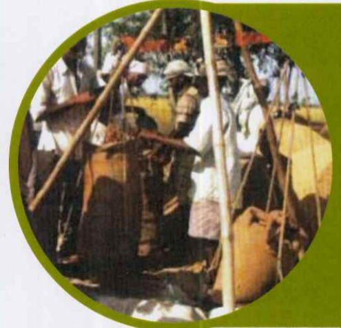
కొనుగోలు కేంద్రంనందు ధాన్యం తూకము చేయుట