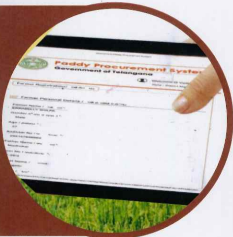
రైతు వివరముల నమోదు ప్రక్రియ