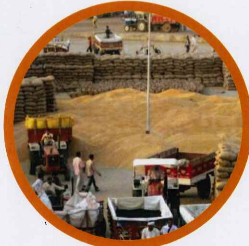
ధాన్యాన్ని బాగా ఆరబెట్టి, చెత్త, తాలు, మట్టి పెద్దలు, రాళ్ళు లేకుండా శుభ్రపరుచుట